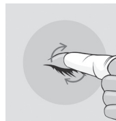
Figura 2: Limpieza de sus párpados y pestañas.

Efectuar un suave masaje en los párpados realizando pequeños movimientos circulares para eliminar costras, secreciones o maquillaje.